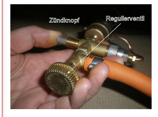
Zündknopf = Tête d'allumage Regulierventil = Soupape de réglage